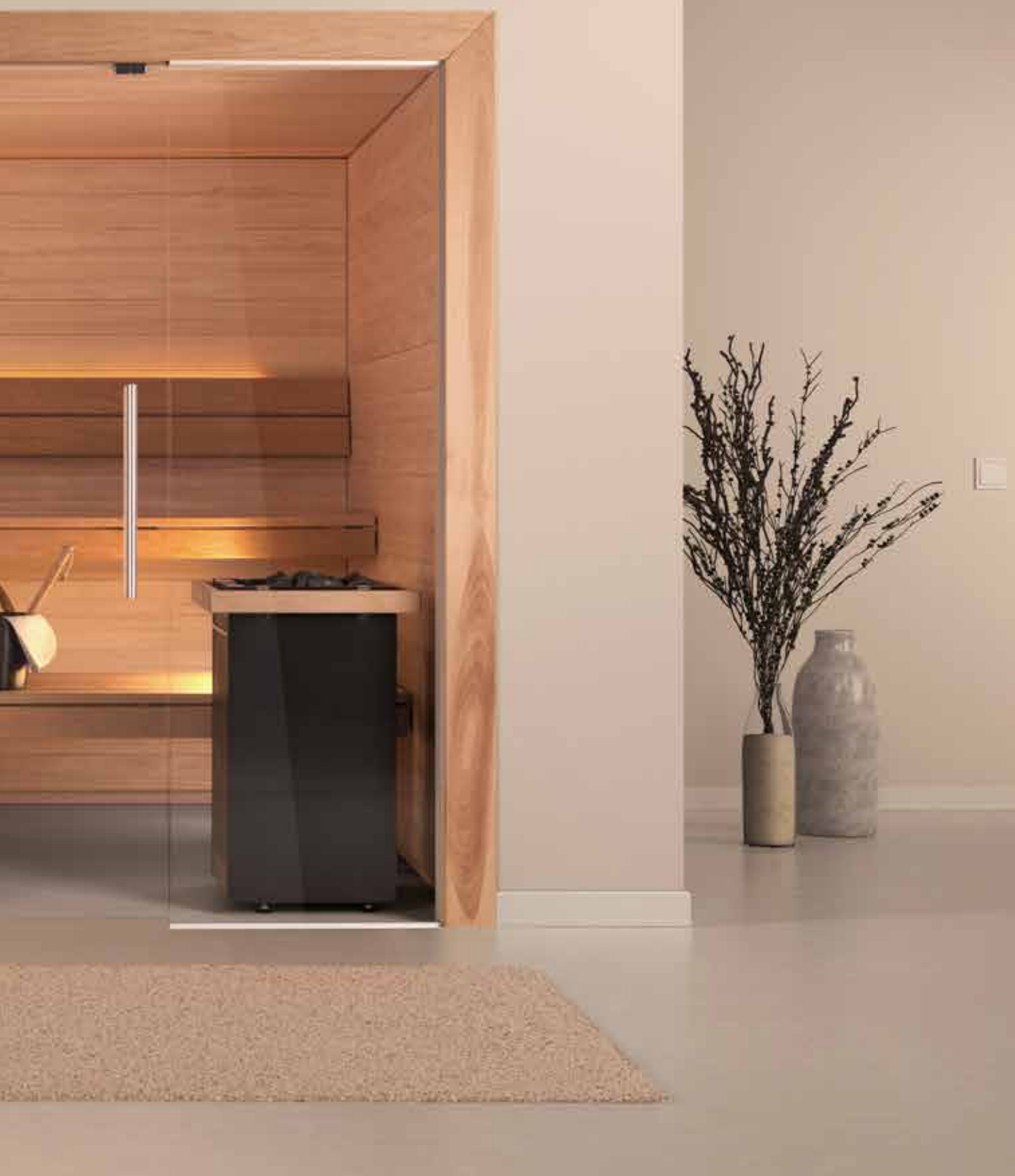
Viliv Novum mit Saunaofen ,Viliv Kvadrat'